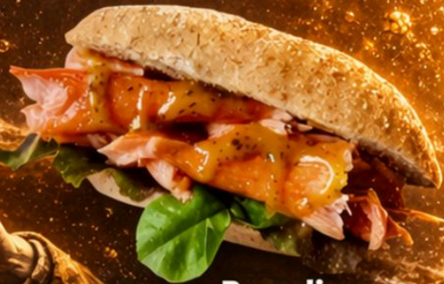
Broodje Warmgerookte Zalm