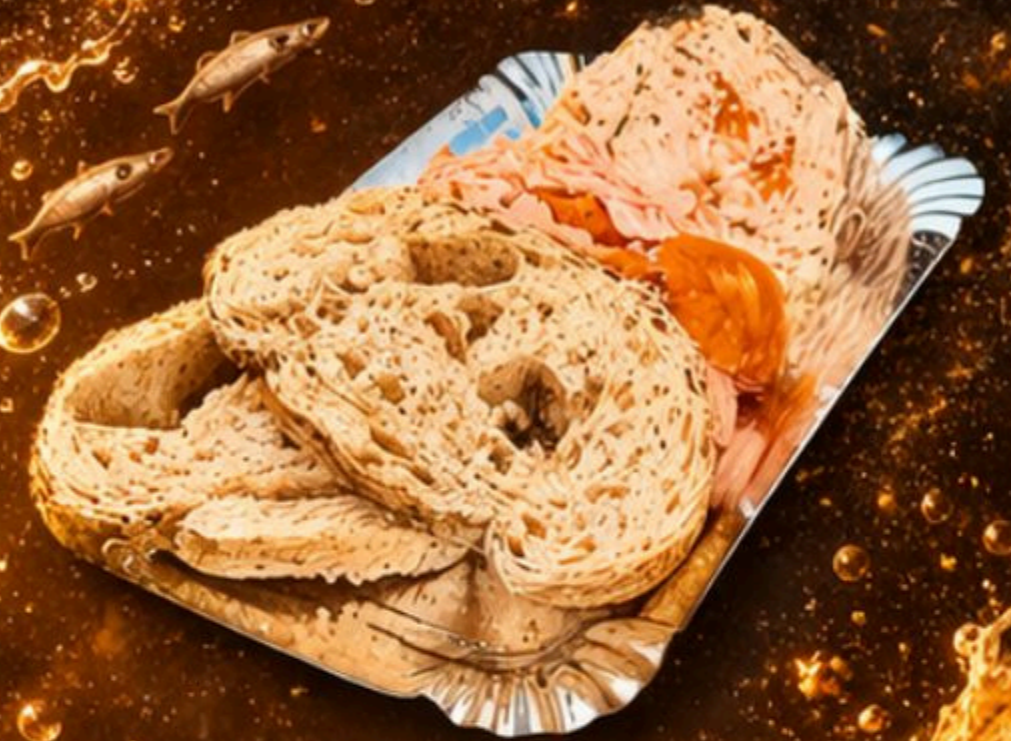
Proeverijtje van Zalm