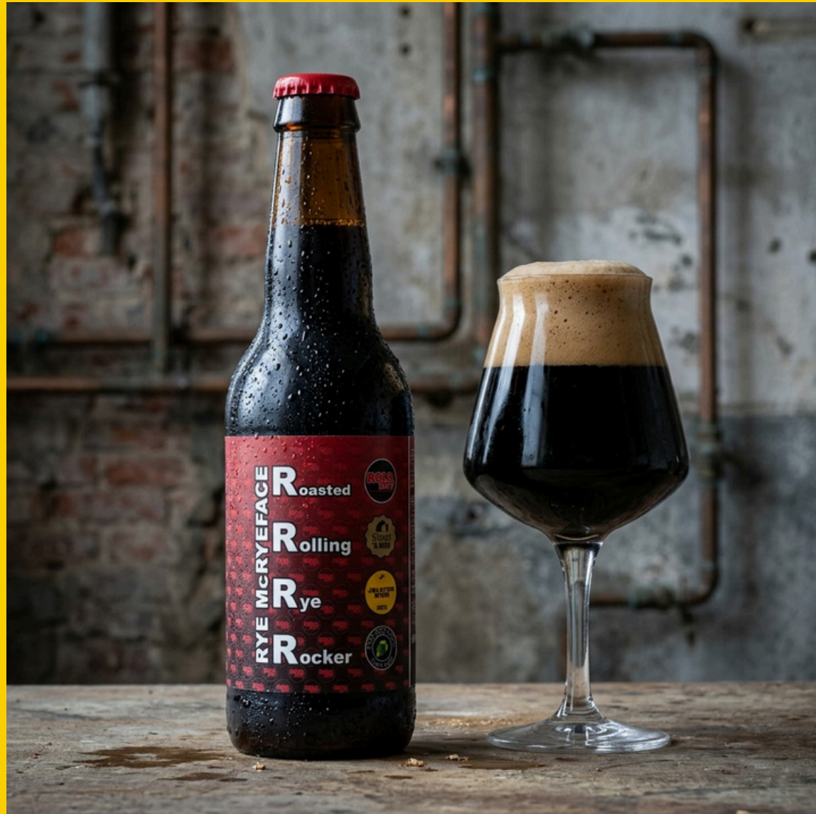
Roasted Rye Rucker